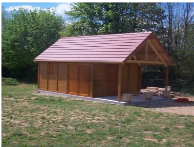
Ex : Bâtiment avec auvent considéré comme clos et couvert

Je fais construire un bâtiment non résidentiel avec panneaux photovoltaïques. Est-il possible de bénéficier pendant deux ans du tarif à 37 c€/kWh, puis de demander à bénéficier pendant les 18 ans restant du tarif intégré au bâti (44 c€/kWh ou 51 c€/kWh suivant les cas) si mes panneaux respectent les critères d'intégration au bâti ?